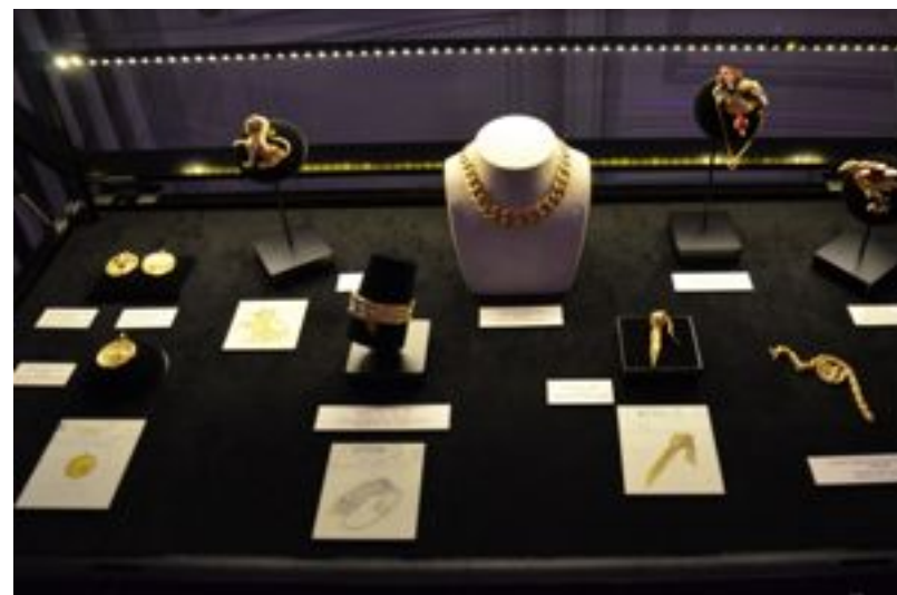
Les bijoux des étudiants

Cerise sur le gâteau: Comme tous les lauréats, Quentin s'est vu remettre un chèque de 1500 euros ainsi qu'un établi équipé offert par des partenaires du prix.